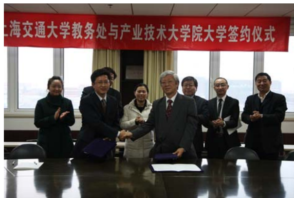
上海交通大学にて